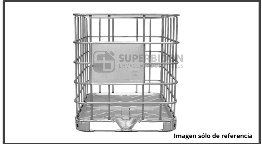
Imagen sólo de referencia

La Rejilla de acero para IBC reacondicionada es una solución práctica y económica para reemplazar estructuras metálicas dañadas o deterioradas en contenedores IBC de 1000 litros . Diseñada para recuperar la funcionalidad de estanques existentes, permite prolongar la vida útil de equipos que aún cuentan con un botellón en buenas condiciones, evitando la necesidad de reemplazar el conjunto completo.